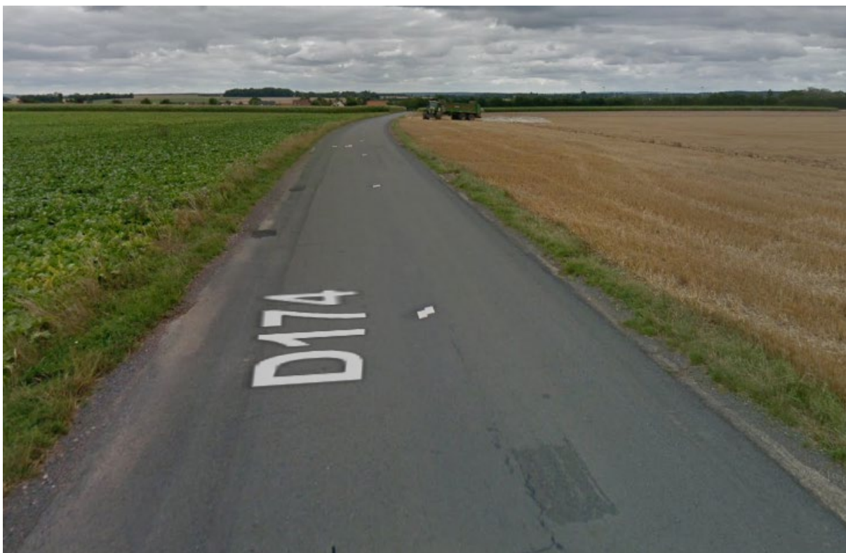
RD174 en direction d'Evrecy

Le projet objet de la présente demande concerne l'aménagement d'une liaison douce, voie de communication réservée aux modes de déplacements non-motorisés , entre Evrecy et Bougy.